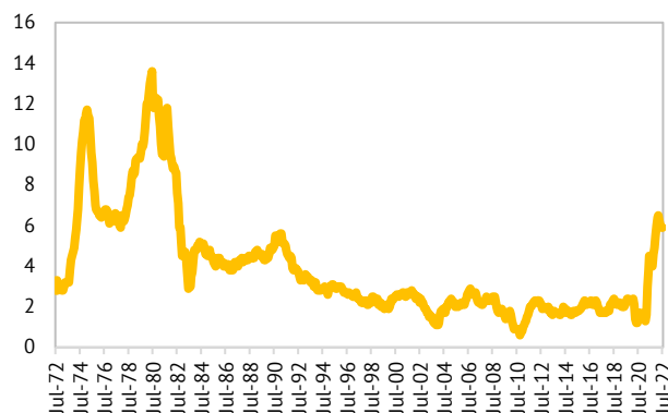
Prognoze pentru prețurile de consum din SUA (% an/an)